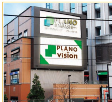
JR飯田橋駅ホームより