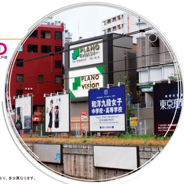
※画面はハメコミ合成のイメージです

※所要時間は、日中平常時のもので、時間帯により、多少異なります。乗り換え時間や待ち時間は含まれません。