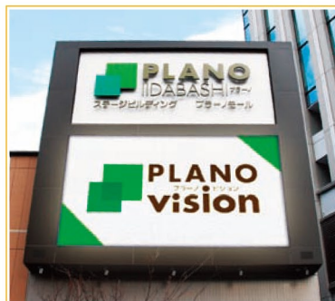
※画面はハメコミ合成のイメージです